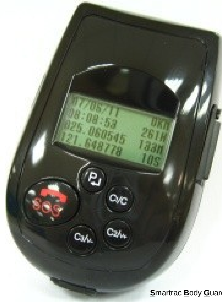
Smartrac Body Guard 200